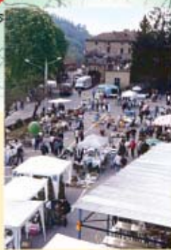
Al Barat d'Ausan