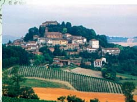
Veduta di Ozzano

del vasto parco, alle boscoso colline della Valle Cerrina. Giunti a Rollini, frazione che in parte si trova nel comune di Ozzano ed in parte in quello di Pontestura, e superata la chiesetta dedicata a S. Rita, si arriva alla piccola frazione Dionigi Rollini e, oltrepassata, si svolta a sinistra imboccando una strada di campagna che, piegando lievemente a destra, taglia la sommità del colle. Si scende rapidamente verso il fondovalle fiancheggiando a destra una siepe rigogliosa composta da svariate specie: sanguinello, biancospino, ligustro, olmo ma anche quercia, frassino e robinia. Si raggiunge la strada inghiaiaata nel fondovalle e la si imbecca svoltando a sinistra e, dopo pochi passi, superato il ponte sul piccolo Rio Rivara, si prende a destra affrontando, ora, una ripida salita che porta, affiancando prima la cascina Costabianca e successivamente la cascina Ravà, ad un trivio posto su un largo pianoro. Scendendo a destra, la via intrapresa, nell'ultimo tratto, scorre al fianco di una lunga cancellata, all'interno della quale si trova, nascosta dalla vegetazione, l'imboccatura della galleria Laurenta, in regione Ravaro, che trova il suo secondo sbocco nel territorio casalese, in regione Pelizza. L'itinerario si conclude ricongiungendosi alla Via Fontanola.