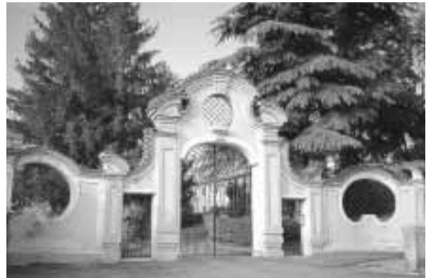
L'ingresso della Villa del Carretto a Moncestino

Domenica 2 aprile continueranno le passeggiate di «Camminare il Monferrato», organizzate dal Parco Naturale e Area attrezzata del Sacro Monte di Crea in collaborazione con il CAI di Casale e i Comuni della Valle Cerrina. Si tratta - come noto - di un'iniziativa promossa al fine di scoprire le bellezze naturali, storiche e artistiche del territorio monferrato e che ha riscosso un notevole successo nelle precedenti escursioni.